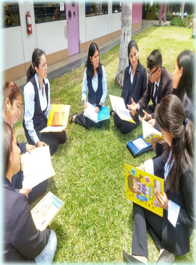
Nuestros Estudiantes Compartiendo ideas